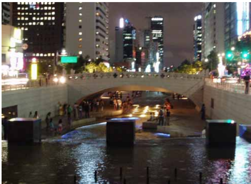
ライトアップされた清溪川で涼むソウル市民 (2006.7.26 夜撮影)