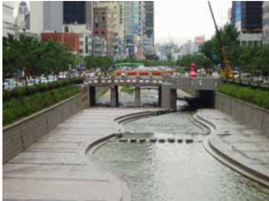
< 川沿いの散策路 2 > (2006.7.28 撮影)

夜になると周辺が青や赤の照明でライトアップされ、たくさんの若者が水辺に集まる。川の両サイドのビルの影響も受け、涼しい風が川沿いに流れるのが印象的。