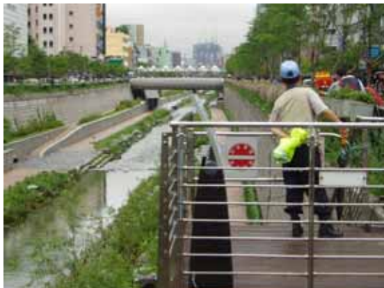
<安全管理の職員> (2006.7.28 撮影)

川への容易なアクセス性は、同時に洪水時のリスクとなり得るが、非常時にはソウル市職員が川沿いに配置され、川へのアクセス道路の入口が閉鎖される。