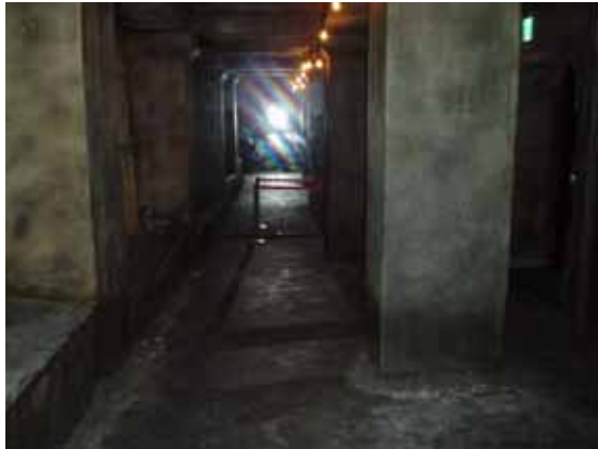
< 清溪川復元前の暗渠内地下空間 > ( 2006.7.27 撮影 )