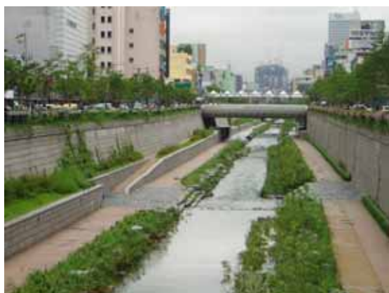
<川沿いの散策路> (2006.7.28 撮影)

出典：ソウル市ホームページ http://japanese.seoul.go.kr/cheonggye/