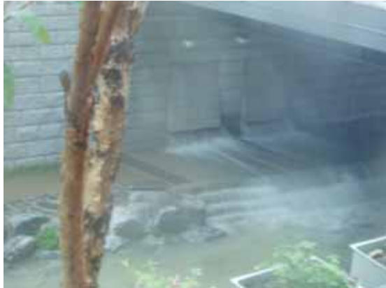
<排水口が開き雨水が合流> (2006.7.27 撮影)