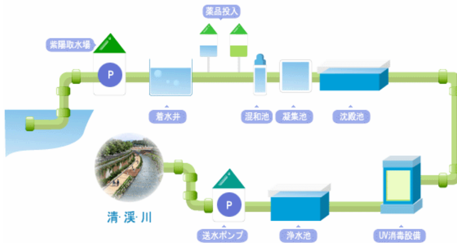
清溪川を流れる水の水処理過程(漢江+地下水 清溪川へ)

http://japanese.metro.seoul.kr/chungaehome/seoul/main.htm