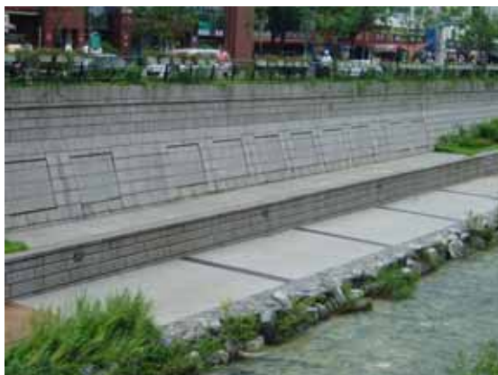
< 開閉式の排水口 > (2006.7.28 撮影)

平常時は滝となり、水しぶきの横を散策ができ、少量の都市排水は遊歩道の下より清溪川に合流している。しかし、この滝の部分全てが実は都市排水溝の合流口。洪水時には道路排水が合流する仕組み。