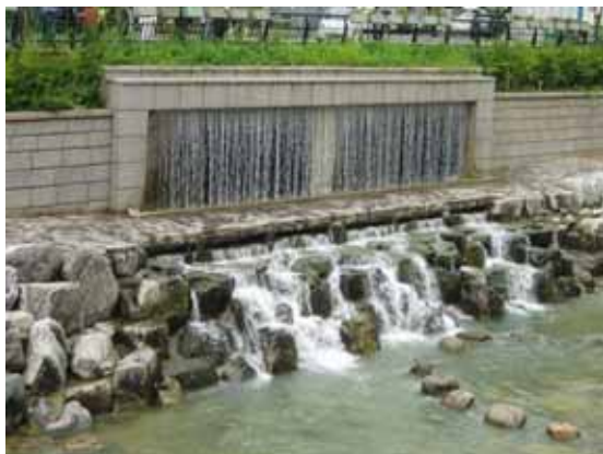
< 大規模排水路幹線の合流点 > (2006.7.28 撮影)

平常時は滝となり、水しぶきの横を散策ができ、少量の都市排水は遊歩道の下より清溪川に合流している。しかし、この滝の部分全てが実は都市排水溝の合流口。洪水時には道路排水が合流する仕組み。