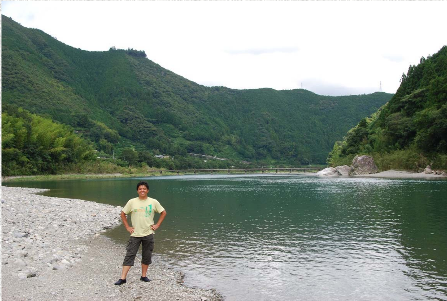
仁淀川泳ぎを終えて気分爽快の記念撮影。