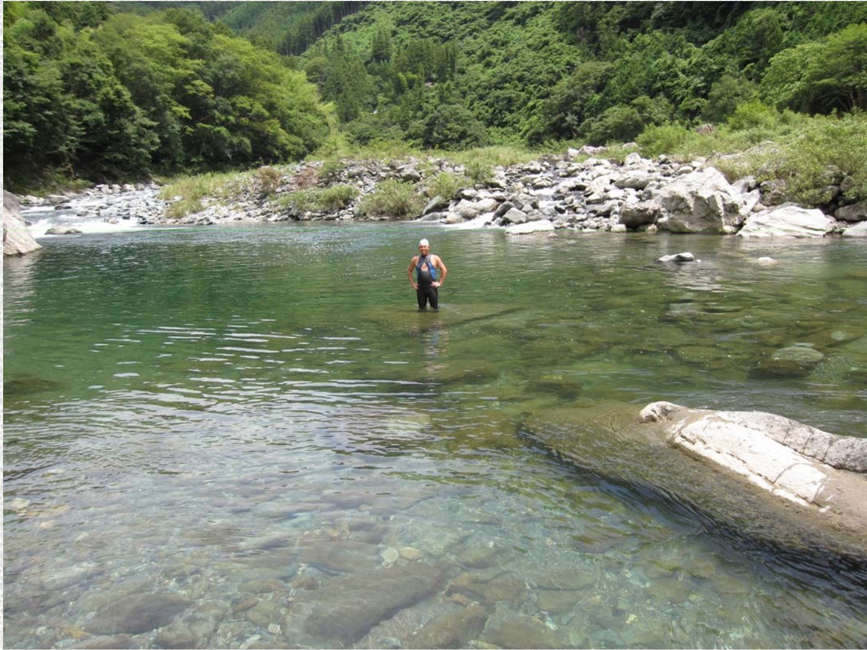
淵の手前から清流泳ぎをスタート。