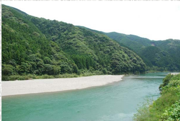
仁淀川中流部（2011.8.8撮影）

仁淀川は、その源を愛媛県の石鎚山系に発し、蛇行を繰り返しながら多くの支流を集め、高知県土佐市で太平洋へと注ぐ1級河川。流域内人口は約10万人。国の平均水質ランキングで四国一位を連続して獲得する程の美しい川で、四万十川と同じく、川遊び、水泳、釣り、カヌー、キャンプとリバーツーリズムのメッカ的な存在です。