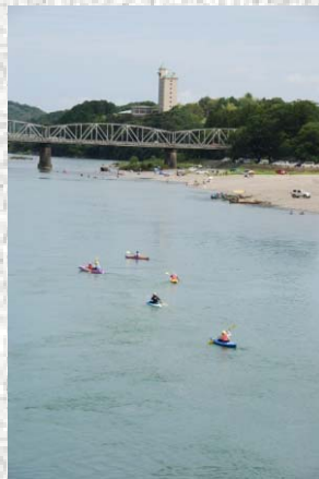
いの町の親水エリア（2011.8.8撮影）