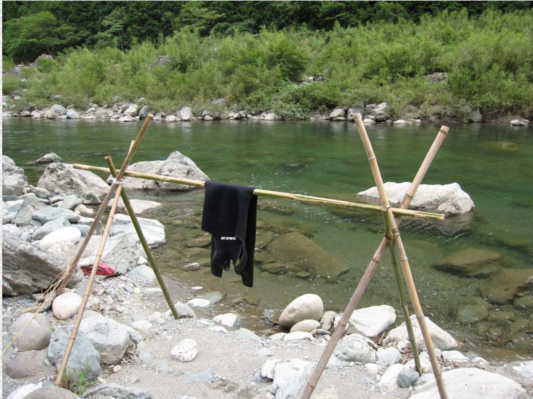
面河川で泳いだあとはウェットスーツの天日干し。