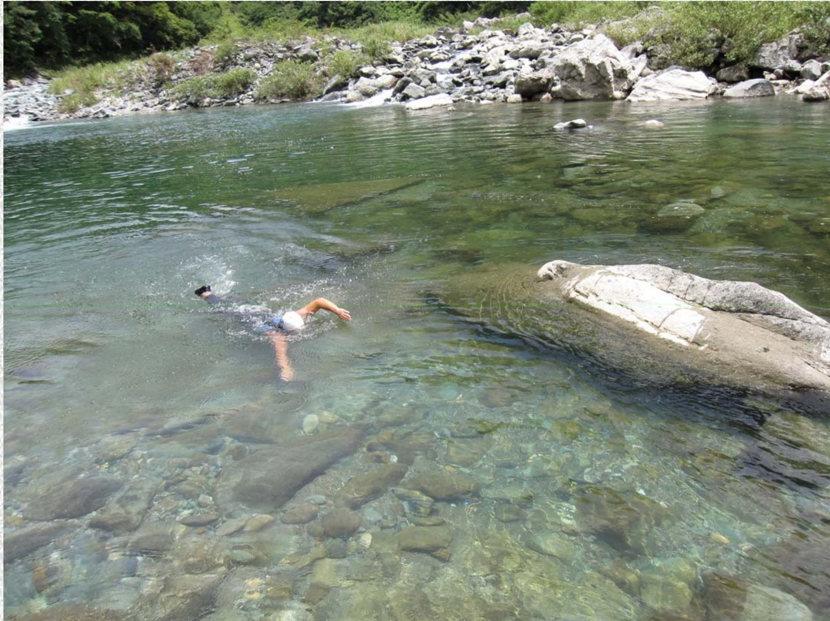
透明度抜群で小魚もたくさん発見。