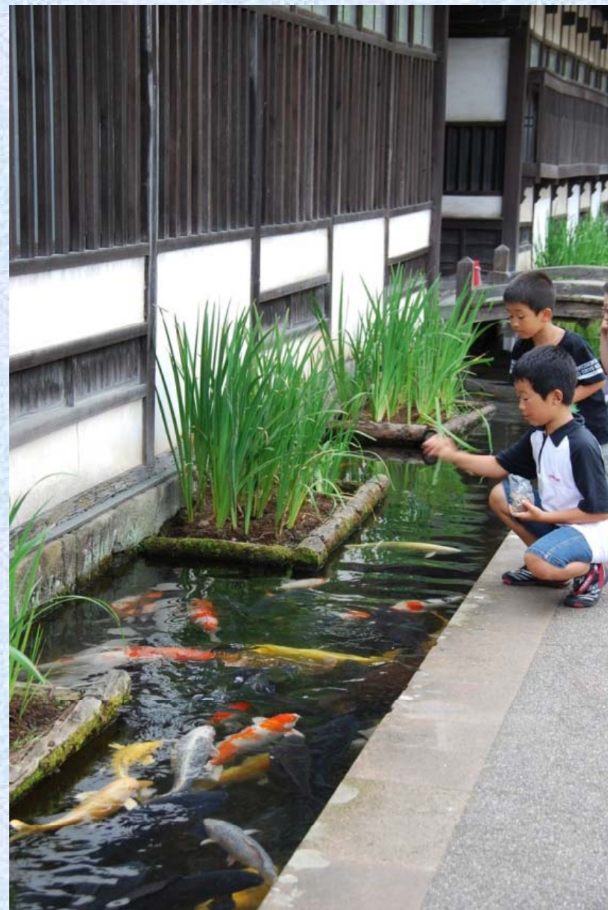
道路を潜って鯉の待つ反対側へ。