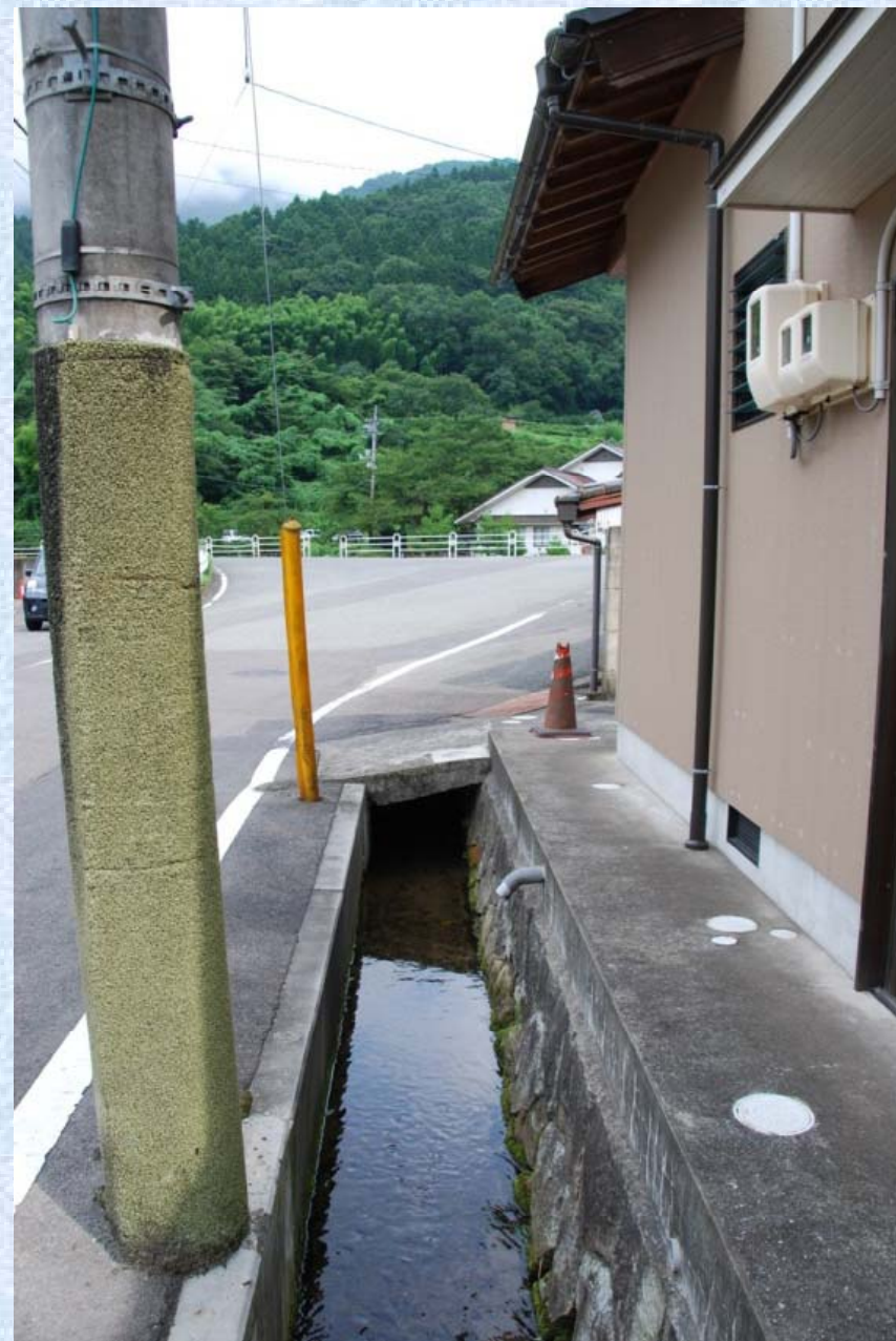
津和野川へと向かう途中にも水利用の足跡が。