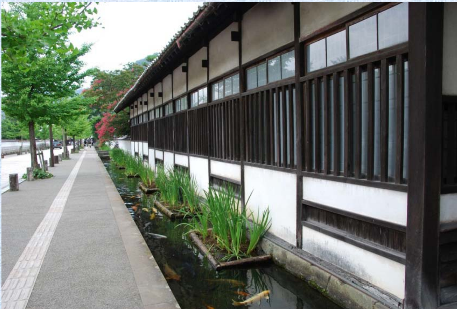
津和野のメインストリート。