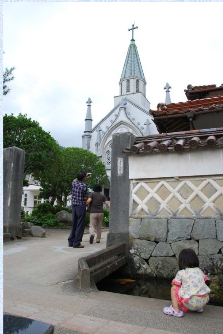
街を流れる水がたくさんの人と交わる瞬間。