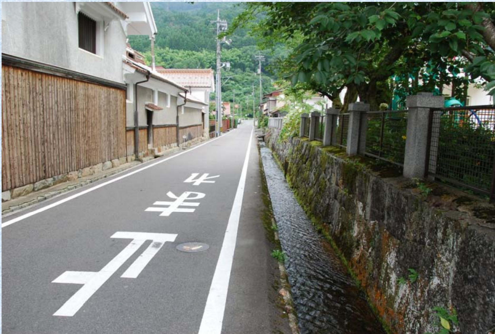
津和野川へとひたすら進む。