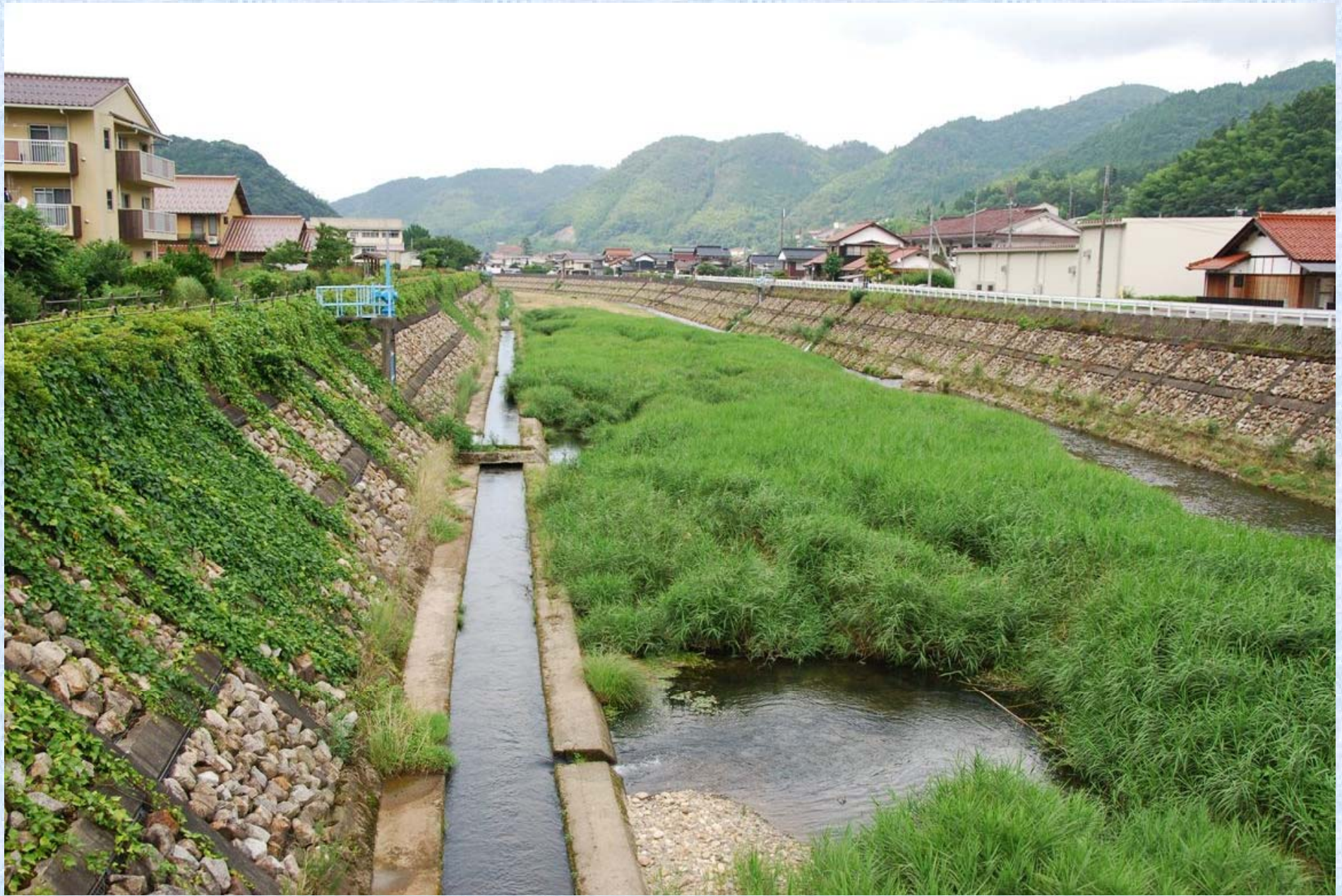
津和野川に寄り添って街へとつづく。