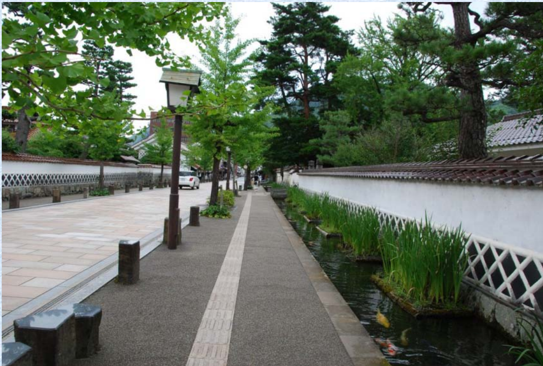
初夏の花菖蒲にリベンジを。